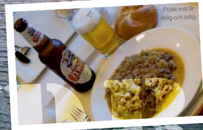
Polsk mat är riklig och billig.