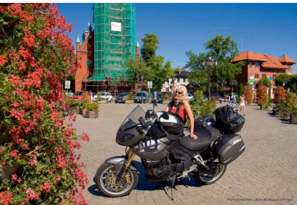
I Kartuzy stannar vi till för att äta god sjötunga.

P lanen är att ta Polferries över till Gdansk en helg och köra runt i norra Polen. Med mig har jag fotografen Mats Olofsson. Han är veteranrörd och har 14 veteranhojor hemma i garaget. När vi kör ombord på färjan i Nynäs visar det sig att lastrummet är fullt med gamla ryska pansarbandvagnar som tydligen också ska till Polen samma kväll. Då känns det verkligen som att vi är på väg till östlanderna.