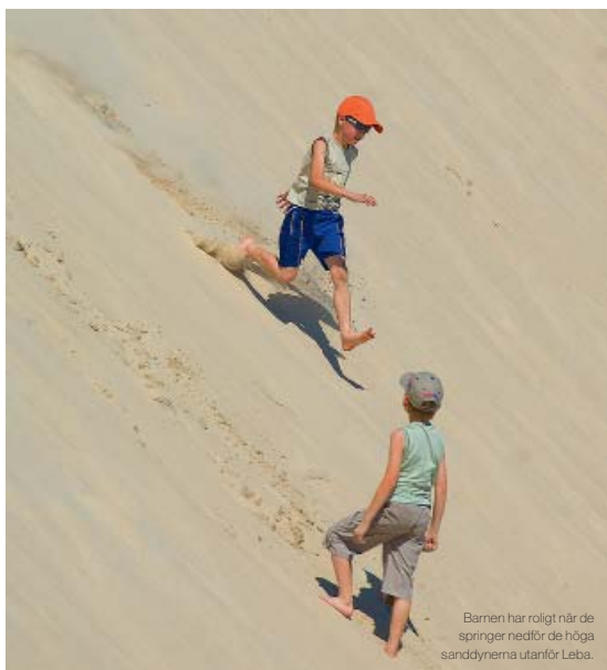
Barnen har roligt när de springer nedför de höga sanddynerna utanför Leba.

Ser jordgubbsplockare på ett stort fält och en underbar doft av solmogna jordgubbar sprids i luften. Vi kör längs långa aléer av lövträd och fram mot eftermiddagen kommer sommarens parfym fram. Hela luften fylls av en stark doft av fläder och lindblom som väcker upp känslan av sommar. Efter den lilla orten Tazy tar vi en genväg mellan sädesfälten på en väg av perforerade betongplattor. Annars är vägarna ganska hyfsade efter Darovar och vi åker in en snabb sväng för att få en skymt av kuststäderna Darlowa och Ustka. De verkar båda vara mysiga sommarstäder med restauranger, hotell, barer, en trevlig liten hamn och företrädesvis polska turister. Vi har dock en bit kvar att köra så vi fortsätter till Leba, en annan badort längs kusten där vi tänker övernatta.