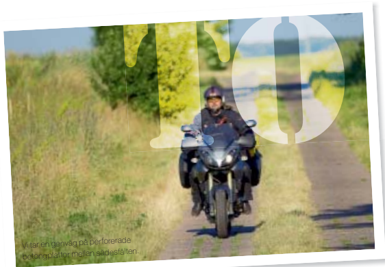
Vi kör barväg på perforerade betongplattor mellan sädesfälten.

Vi kör mot Mielo som är en känd badort, speciellt för semestrande polacker. På den långa raka gatan som går parallellt med havet ligger säkert hundratals restauranger, barer och enkla marknadsstånd med krims-krams på båda sidor. Det är lite lågbudget över badorten med en hel del kitschiga snäcksouvenirer. På kvällarna blir det fullt ös på nattlivet. Vi går en sväng på stranden och det är fullkomligt packat med färgglada parasoller och solstolar så långt ögat når. Sanden är härligt vit och det är förvånande att inte fler svenskar hittar hit till dessa underbara stränder med finkornig sand som bara fortsätter kilometervis. Temperaturen är runt 35 grader och vi är rejält hungriga så vi stannar till vid en restaurang i utkanten av Mielo. Här beställer vi god grillad fisk för 35 kronor. Efter lunch fortsätter vi en bit ut på den smala raka landtungan nära havet men blir tvungna att vända när vägen tar slut och bara en cykelväg återstår. Kör istället en bit inåt landet mot kuststaden Darlowa. Landskapet liknar Englands böljande landskap med små byar med välbehållna hus.