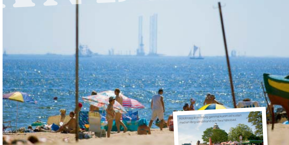
Kolobrzeg är en trevlig gammal kurort vid kusten med en lång sandstrand och flera hälsobad.