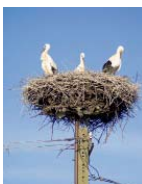
På telefonstolpar kan man se stora storkbön i norra delen av Polen.

Vi kör mot Mielo som är en känd badort, speciellt för semestrande polacker. På den långa raka gatan som går parallellt med havet ligger säkert hundratals restauranger, barer och enkla marknadsstånd med krims-krams på båda sidor. Det är lite lågbudget över badorten med en hel del kitschiga snäcksouvenirer. På kvällarna blir det fullt ös på nattlivet. Vi går en sväng på stranden och det är fullkomligt packat med färgglada parasoller och solstolar så långt ögat når. Sanden är härligt vit och det är förvånande att inte fler svenskar hittar hit till dessa underbara stränder med finkornig sand som bara fortsätter kilometervis. Temperaturen är runt 35 grader och vi är rejält hungriga så vi stannar till vid en restaurang i utkanten av Mielo. Här beställer vi god grillad fisk för 35 kronor. Efter lunch fortsätter vi en bit ut på den smala raka landtungan nära havet men blir tvungna att vända när vägen tar slut och bara en cykelväg återstår. Kör istället en bit inåt landet mot kuststaden Darlowa. Landskapet liknar Englands böljande landskap med små byar med välbehållna hus.