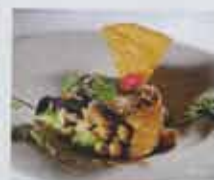
Keskiaikaa lautasella. Viikunaa, vuohenjuustoa, kikherneitä ja rapeaa keksiä.

Gothicissa Gałazkalla on käytössä linnan reseptiaarteita ja tili- kirjojen listauksia ritarikunnan ruokamieltyksistä.