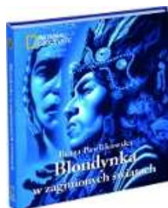
Blondynka w zaginionych światach