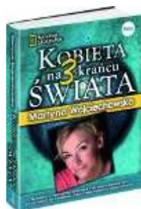
Kobieta na krańcu świata 3