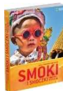
Smoki i smoczki