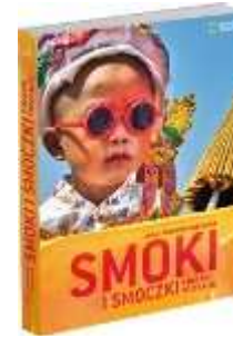
Smoki i smoczki