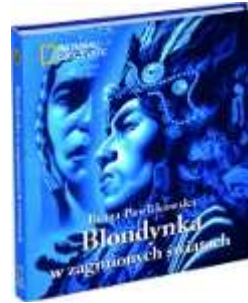
Blondynka w zaginionych światach