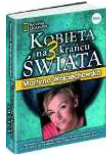
Kobieta na krańcu świata 3