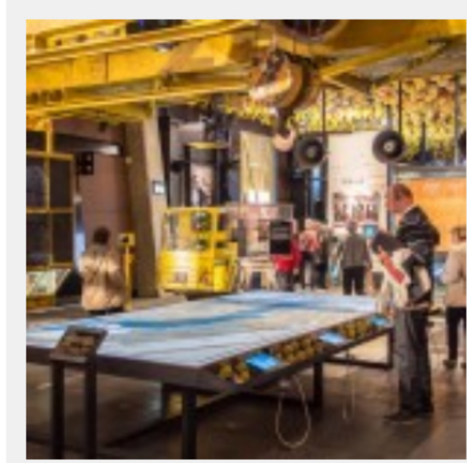
Europejskie Centrum Solidarności