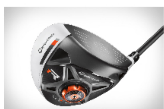
TaylorMade R1 Driver – nowy kij do golfa