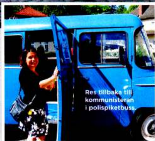
Res tillbaka till kommunisteran i polispiкетbuss.

Pris: ca 90 kr för vuxna, barn betalar halva priset.