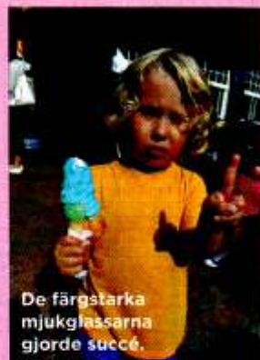
De färgstarka mjukglassarna gjorde succé.

Det är inte svårt att hitta god mat i Polen, tvärtemot vad många tycks tro. Tänk svensk husmanskost med inslag av medelhavsmat (mycket grillad fisk och vitlök) och rustika ryska rätter som matiga blinier och rödbetsoppor – där har du det polska köket.