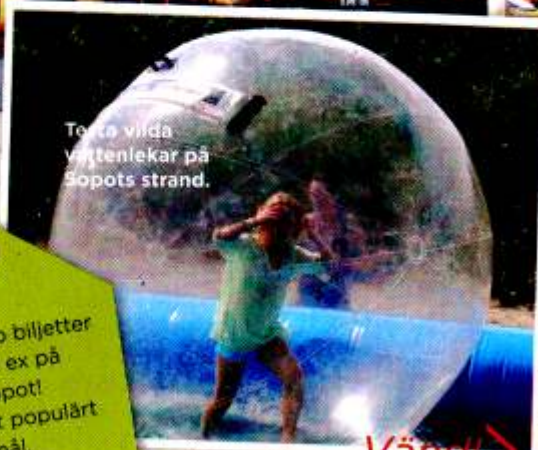
Testa vilda vattenlekar på Sopots strand.

Tips! Köp biljetter i förväg, t ex på piren i Sopot! Hel är ett populärt utflyktsmål.