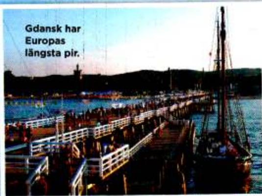
Gdansk har Europas längsta pir.

● Otrevligt, grått och smutsigt, tänker du kanske. Sorry, men de fördomarna kanske stämde 1991!